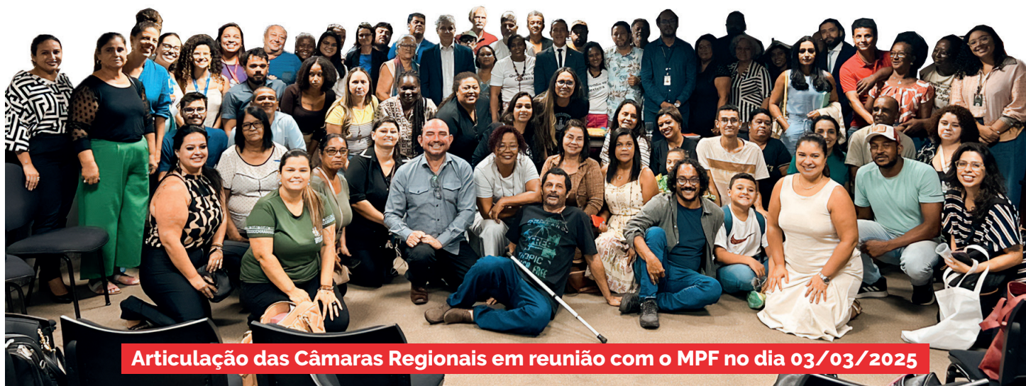
Articulação das Câmaras Regionais em reunião com o MPF no dia 03/03/2025